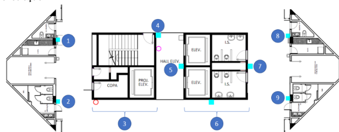
■ Dispensador de álcool em gel fixo na parede