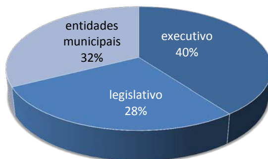
Gráfico 1 – Análises em processos de prestações de contas de âmbito municipal.