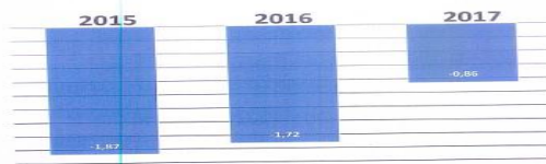
QUADRO EVIDENCIANDO O PERCENTUAL DOS DÉFICIT E SUA QUEDA ANO APOS ANO.

Por sua vez, na Instrução n.º 1.773/20 (peça n.º 42), a Unidade transcreveu o evidenciado na análise anterior a respeito do cancelamento de restos a pagar em exercícios seguintes ao da análise, ratificando seu opinativo pela inconformidade e reafirmando que o cancelamento de Restos a Pagar só traz efeitos no exercício em que se deu, sem afetar o resultado de exercícios anteriores.